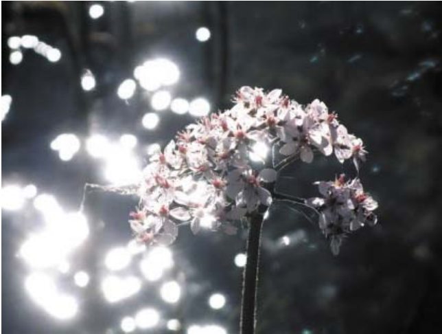
jeux de lumière fleurie

SP : Treize rencontres constituent l'ouvrage. Quel en est le fil conducteur ?