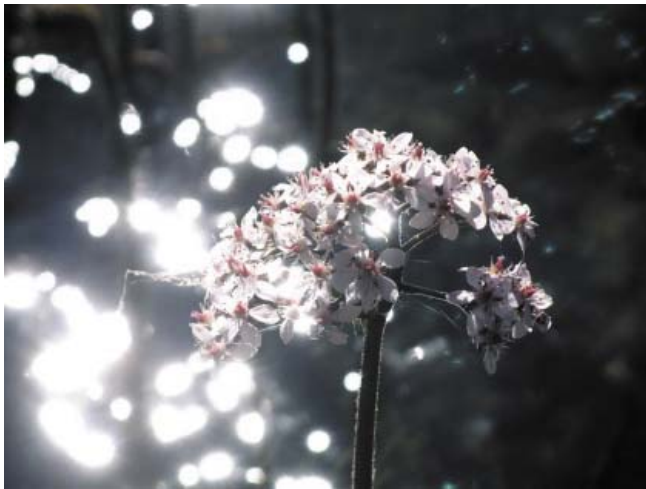
jeux de lumière fleurie

SP : Treize rencontres constituent l'ouvrage. Quel en est le fil conducteur ?